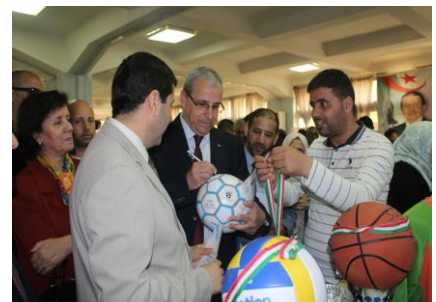
Dédicace du Recteur d'un ballon de foot

Wali d'Oran les autorités locales et les chefs d'établissements universitaires de la ville d'Oran qui ont ensuite assisté à la remise de prix pour les équipes vainqueurs des différents tournois.