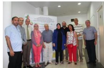
12 partenaires ont signé la convention

Sous l'égide de la Direction Générale de la Recherche et le développement Technologique du Ministère de l'Enseignement Supérieur et la recherche Scientifique et via ses deux Agences Thématiques de Recherche en Science et Technologie et en Science Sociales et Humaines, L'université Oran1 a signé, le 15 juillet 2018 au siège du Rectorat, un mémorandum d'entente avec 12 partenaires pour la réalisation d'un projet de recherche intitulé : « Ecodéveloppement : Ville Durable et Application à l'industrie du papier »