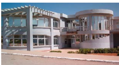
Bibliothèque des Sciences