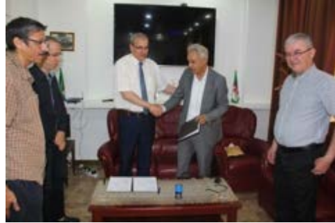
Mr le recteur avec le directeur « Alfatron Electronic Industries »

Cette Convention porte sur la collaboration avec le laboratoire de recherche LITIO pour le montage d'unités de calcul intensif (UCI) en intégrant du matériel de cette entreprise, avec une suite logicielle HPC adéquate.