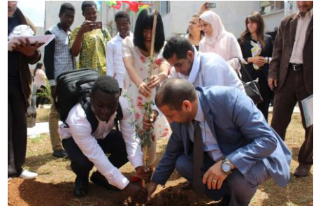
Vice-recteur de la pédagogie, la lectrice chinoise et un étudiant plantent un arbre comme symbole de la paix

A l'occasion de la journée nationale du vivre ensemble en Paix, célébrée le 16 Mai de chaque année, l'Université d'Oran 1 Ahmed Ben Bella à fêté cette journée en conviant l'ensemble de la communauté des étudiants étrangers a une conférence « Effets de la Paix sur les relations internationales » et ensuite à la plantation d'un olivier dans le campus Mourad Taleb (Ex. IGMO) symbole la paix. L'objet de cette célébration est de diffuser l'esprit de tolérance et la culture de la paix.